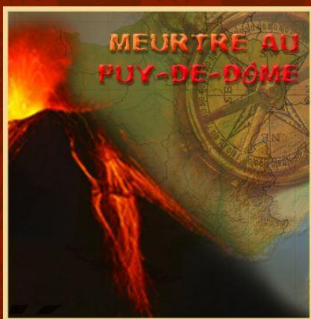
Meurtre au Puy-de-Dôme (2 salles de jeu)