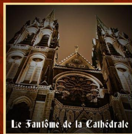
Le fantôme de la Cathédrale (2 salles de jeu)

Escape Hunt a ouvert ses portes à Bordeaux, Paris, Nancy, Marseille, Clermont-Ferrand, la Rochelle, Nantes et Metz pour offrir aux nouveaux enquêteurs la possibilité d'élucider les mystères de leur ville... Escape Hunt devient ainsi le premier acteur du pays dans ce domaine d'activité avec 53 salles de jeux et 24 énigmes différentes dans 8 villes françaises.